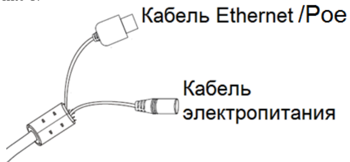
Рисунок 1 – Подключение IP-видеокамеры

9.6. Подключение IP-видеокамеры приведено на рисунке 1.